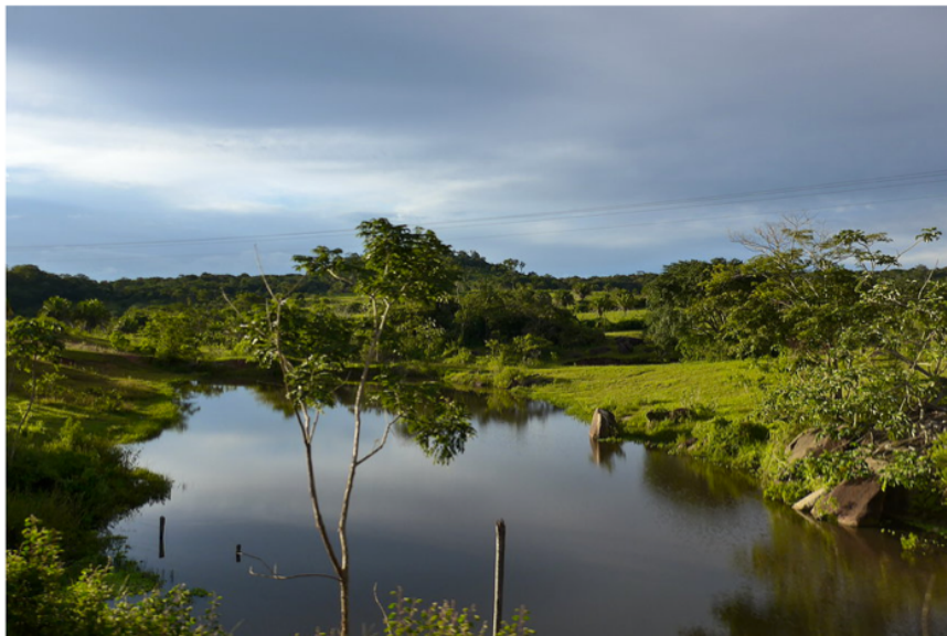
En route vers Santa Cruz

Après près de trois semaines à travailler, me revoilà sur la route.