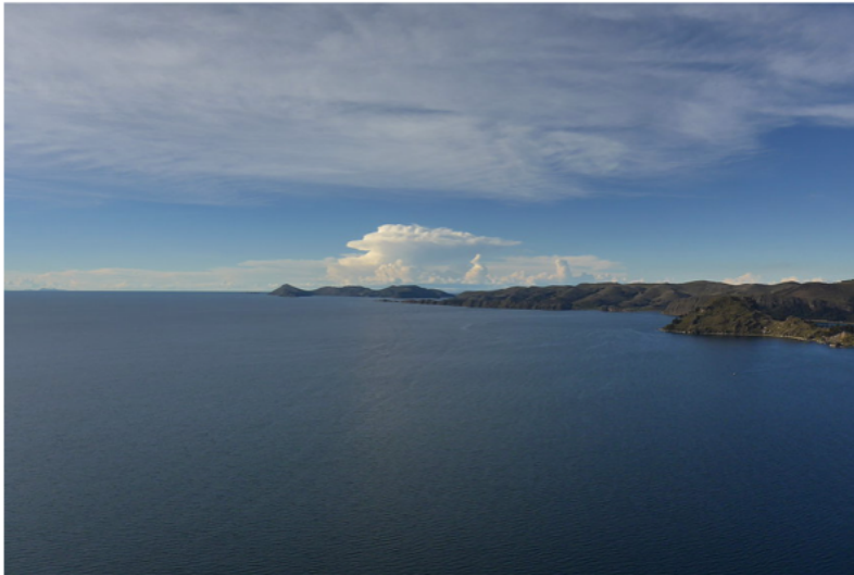
Le Titikaka, cote bolivien